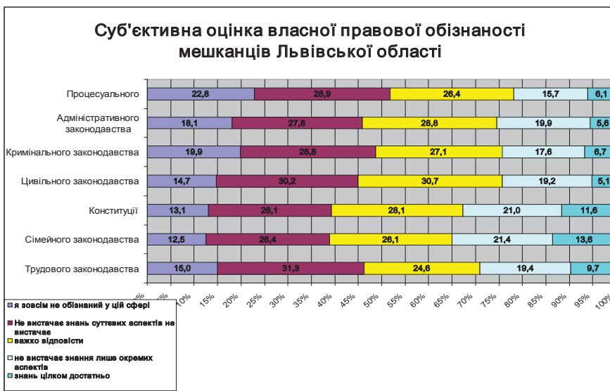
Рис. 1. Суб'єктивна оцінка правової обізнаності мешканців Львівської області

Отже, загалом суб'єктивна оцінка правової обізнаності мешканців Львівської області виглядає так (рис. 1).