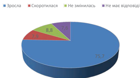
Рис. 3. Кількісний попит на український продукт

Війна стала каталізатором цього процесу, перетворила споживчі практики на стратегію захисту та розвитку української культури і розвинула значну зацікавленість серед українців.