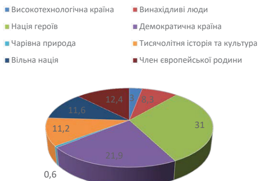
Рис. 1. Популярність бренд-атрибутів України в англомовних медіа, 2023 р.

У різних регіонах України з початку повномасштабної війни збільшилася відмова від російських продуктів, зокрема у сферах культури, освіти, побутового споживання.