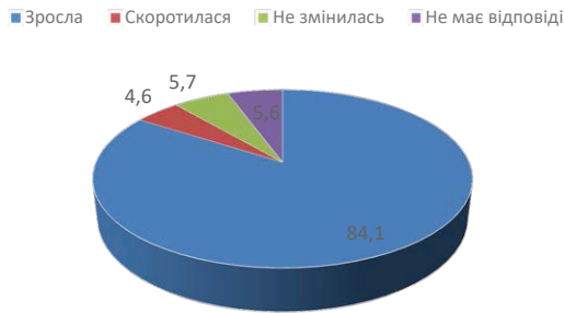
Рис. 4. Зацікавленість в попиті на український продукт

Висновки. Українська культура стала на шлях нової українізації і постає як стратегічний інструмент у процесі державотворення. Цей новітній етап українізації посилюється під час воєнних подій, став відповідно етапом відродження, популяризацію української мови, історичної пам'яті, культурних традицій, розвитку культури, мистецтва, літератури, що сприяє консолідації суспільства. Цей процес має багато проблем і вартий досконалого вивчення. Саме глобалізація дуже значно робить виклики, вона створює конкуренцію між локальною і глобальною культурою. Попри ці труднощі до українізації зростає інтерес, як до культурного відродження, особливо серед молоді та підтримки держави, яка формує сприятливий ґрунт для розвитку.