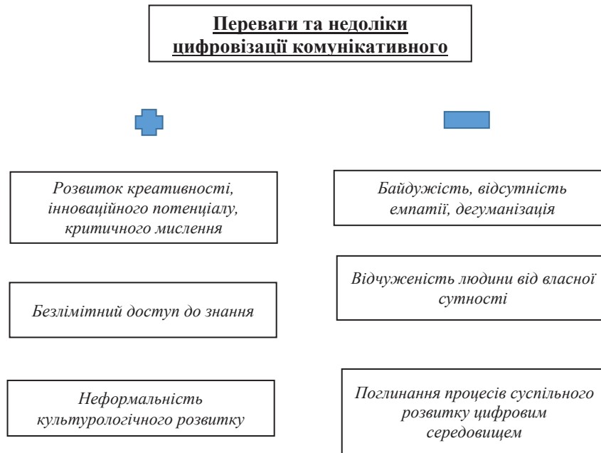
Рис. 2. Переваги та недоліки кіберпростору комунікації