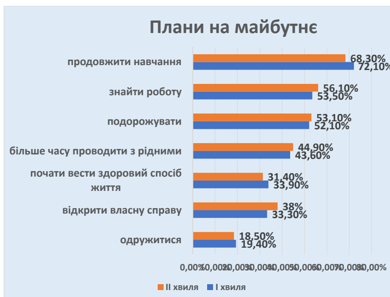
Рис. 1. Плани на майбутнє