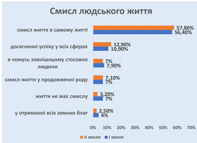
Рис. 3. Смисл людського життя