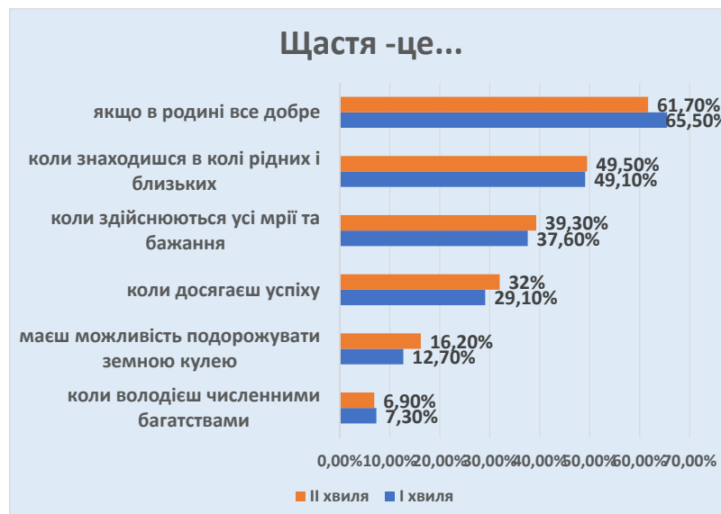
Рис. 4. Щастя – це...

майже 13% опитаних у першу хвилю та дещо більше 16% – у другу хвилю. А щастя та багатства знайшли відгук у незначній кількості опитаних.