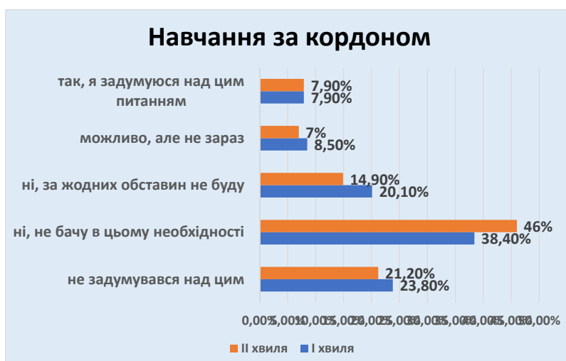
Рис. 6. Навчання за кордоном

Висновки з дослідження та перспективи подальших пошуків. Як показали результати онлайн опитування, для студентської молоді до важливих цінностей відійшло саме життя, вони почали цінувати його більше, а також особливою цінністю є можливість бути поруч із рідними та близькими. Попри складний воєнний час, студенти зберігають психологічну рівновагу, сподіваються, надіються та планують. І ці очікування вони пов'язують з Україною. Наступні дослідження стосуватимуться з'ясування змін у ціннісному світі студентської молоді у наступні періоди війни та повоєнний час.