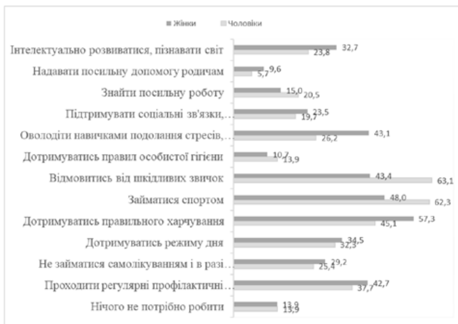
Рис. 3. Розподіл відповідей на питання «Що з перерахованого потрібно, на Ваш погляд, робити, для того, щоб уповільнити процес старіння?» (за статтю), n = 406, %

ного стану. Крім того, можна також відзначити, що в своїх стратегіях уповільнення старіння жінки, у порівнянні з чоловіками, більше прагнуть до інтелектуального розвитку, пізнання світу, підтримки соціальних зв'язків, а чоловіки, порівняно з жінками, більше уваги приділяють пошуку посильної роботи.