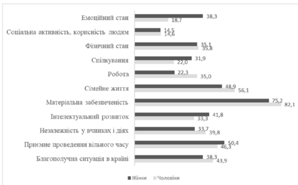
Рис. 1. Розподіл відповідей на питання «Що людині Вашого віку приносить основне задоволення в житті?» (за статтю), n = 406, %

В дослідженні ми також намагалися з'ясувати, якими є головні життєві цінності опитаних, та чи є ці цінності досяжними в старості. Одержані дані дозволяють зробити висновок, що до головних цінностей більшість опитаних відносить матеріальну забезпеченість (77,3%) та сімейне життя (51,1%). При цьому старість, на думку опитаних, супроводжується негативними змінами майже за всіма запропонованими в переліку цінностями, за виключенням проведення вільного часу, незалежності у вчинках й спілкування. Найбільш суттєві негативні зміни відбуваються з фізичним станом