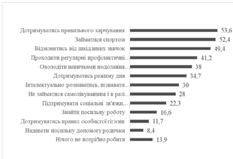
Рис. 2. Розподіл відповідей на питання «Що з перерахованого потрібно, на Ваш погляд, робити, для того, щоб уповільнити процес старіння?» (всі опитані), n = 406, %

Для того, щоб уповільнити процес старіння необхідно, на думку чоловіків, перш за все, відмовитися від шкідливих звичок та займатися спортом. Важливим також є дотримання правильного харчування, регулярні медичні огляди та ін. Для жінок найважливішими виявилися дотримання правильного харчування, заняття спортом, відмова від шкідливих звичок, профілактичні медичні огляди. Але також досить важливим для жінок виявилось оволодіння навичками подолання стресів, збереження позитивного емоцій-