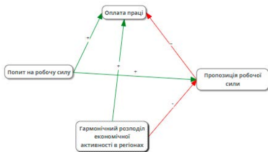
Рис. 1. Когнітивна карта для складників ринку праці

Одразу визначено зв'язок та вплив між факторами, що і відображено в міні-версії когнітивної карти складників ринку праці, зображеної на рисунку 1.