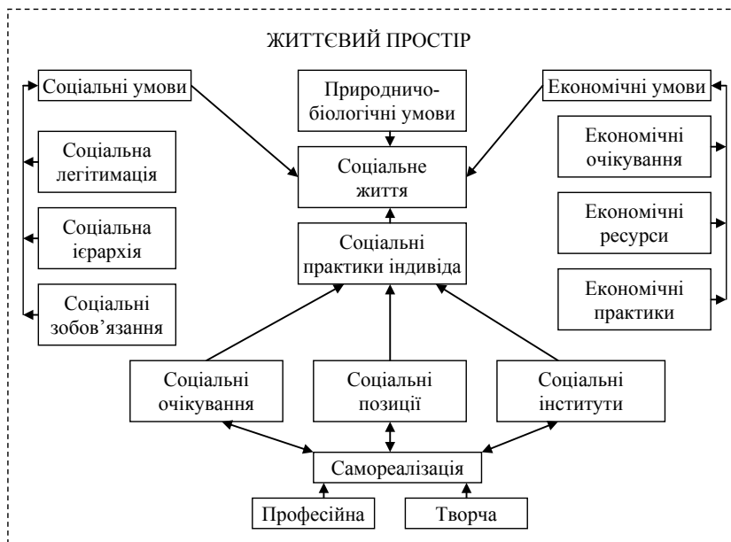
Рис. 2. Модель життєвого простору індивіда

вибір залежить від нас: ними можуть бути окремі люди, групи або сукупність груп [11, с. 298]. Повністю погоджуючись із наведеними твердженнями, вважаємо за необхідне наголосити на тому, що вибір «точок відліку» ускладнюється сучасними економічними та споживацькими практиками, які призводять до суспільної дезорієнтації й порушують структуру соціального, а через нього й життєвого простору.